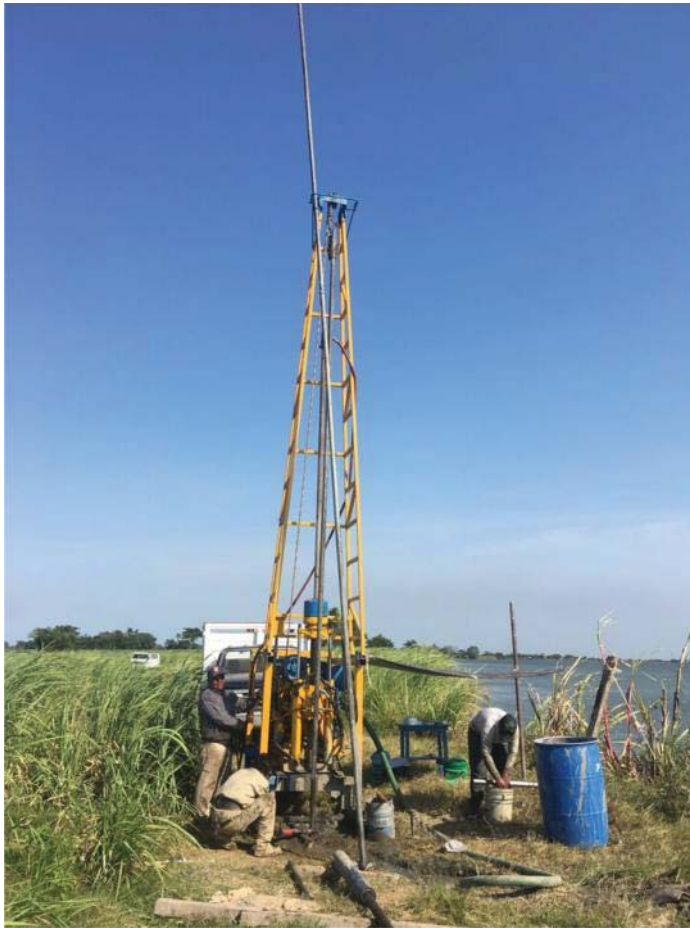
Perforadora rotaria Long Year 34, sobre trineo para de lugares de pendientes fuertes y de difícil acceso