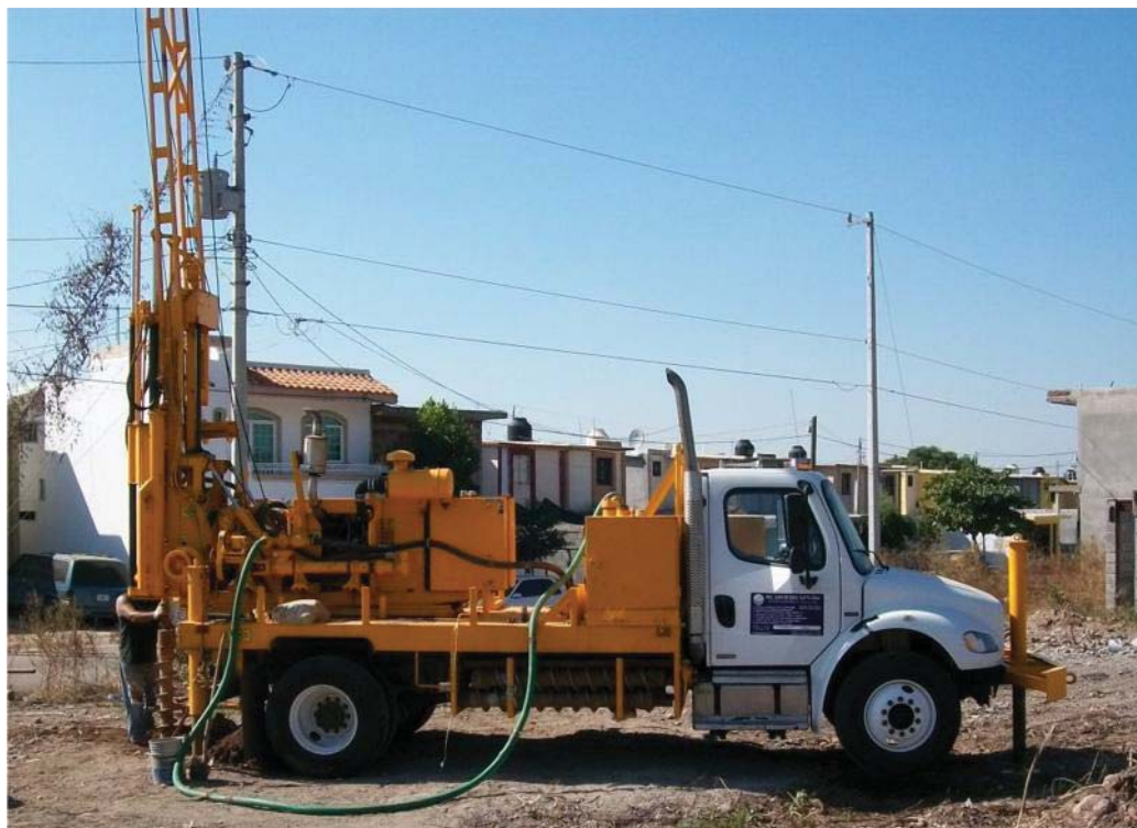
CME-55 , AUGERS