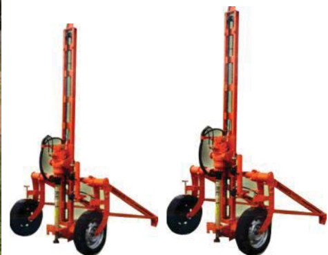
Dos Perforadoras neumáticas Stenuick, con martillo de fondo para estabilización de taludes, inyección de suelos, mejoramiento de suelos, construcción geotécnica.