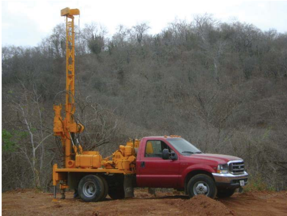
ACKER SOIL SENTRY, AUGERS